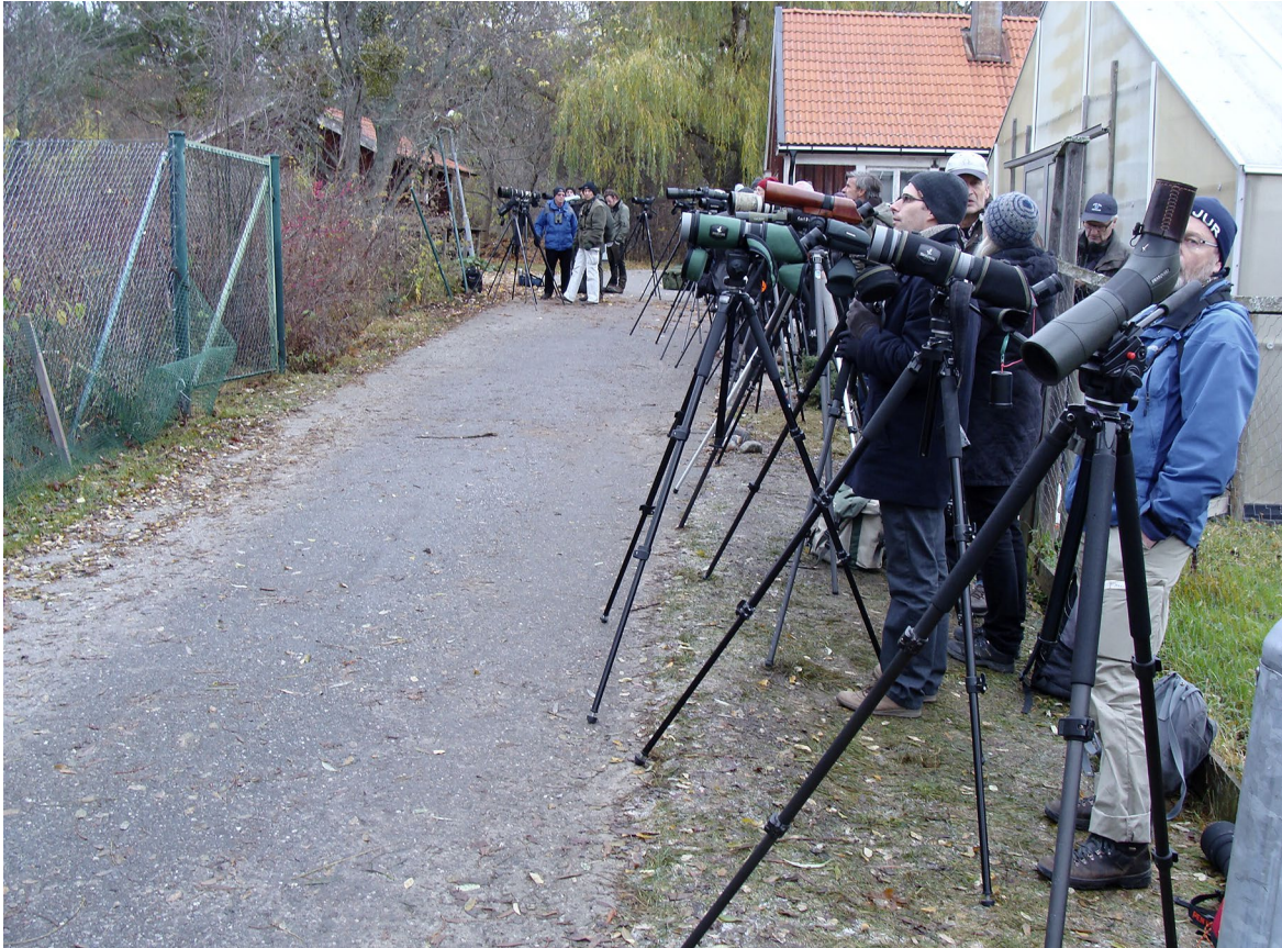
Drag på bruntrast (turdus eunomus), Säbyholms naturbruksgymnasium i Upplands Bro, Uppland, 2011.