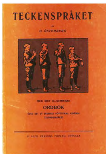
Den första svenska teckenspråksordboken.

över hela landet” 2 . Utgångspunkten var Svenska Akademiens ordlista. De ord som man kunde hitta motsvarande tecken för hamnade i teckenordboken.