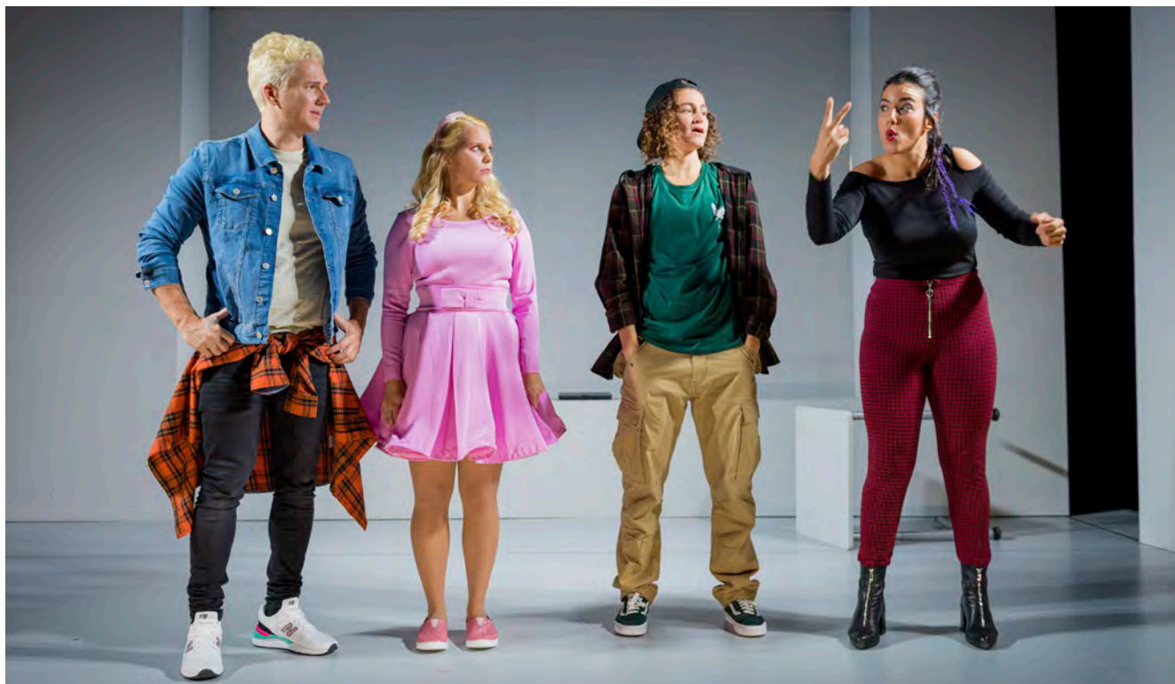
Riksteatern Crea ger föreställningar på teckenspråk, här pjäsen "Superhjältar".